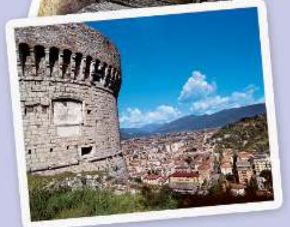
grafico | FOTOSTUDIO RAPUZZI