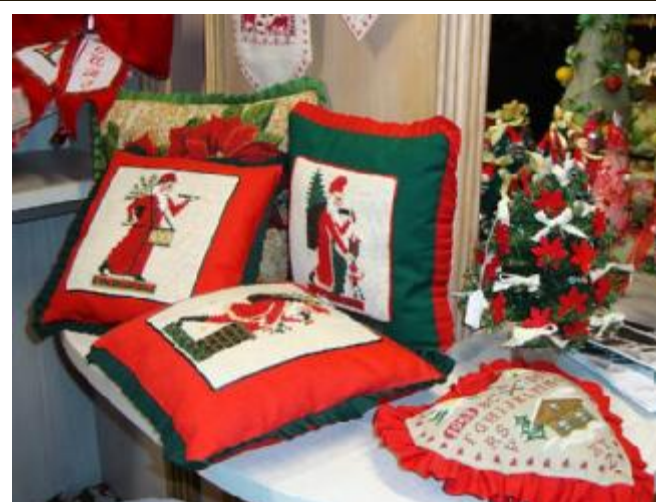
I regali di Natale saranno confezionati a mano dall'Ant

made o tra prodotti offerti da imprese, aziende e negozi nazionali e locali che sostengono l'attività umanitaria dell'associazione. Si troveranno giocattoli, libri, prodotti di bellezza, bigiotteria, vini, gourmanderie, oggetti di design, gioielleria, accessori e abbigliamento di importanti marchi italiani. Tra le novità di quest'anno prodotti di artigianato provenienti dall'Afghanistan, borse colorate ricamate a mano dalle