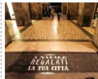
Lo slogan delle iniziative di Natale

Si apre oggi il Natale dei bresciani promosso dal Comune. La rassegna «Tempo di Natale: Brescia il regalo più bello» ravviverà il centro con proposte per tutti i gusti. Tra le più significative spicca l'apertura straordinaria della quarta cella del santuario repubblicano nell'area del Capitolium (la sala affrescata del I secolo a.C. che il Comune intende restaurare), fissata dalle 14 alle 17 e ripetuta domani dalle 10 alle 17. Sempre oggi dalle 14 alle 17 e domani dalle 13 alle 17 verrà aperto anche il percorso archeologico di Palazzo Martinengo. Anche il museo di Santa Giulia sarà protagonista fino all'Epifania con l'esposizione di opere provenienti dai depositi, per l'occasione proposti in percorsi inusuali. L'appuntamento è ogni domenica alle 15.30 con una guida speciale: domani si inizia con «Scene dalla Natività», percorso che affronta l'iconografia di Cristo